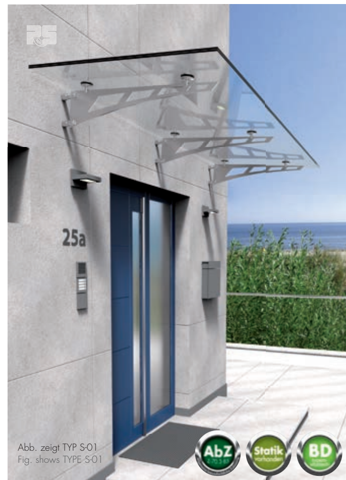
Abb. zeigt TYP S-01 Fig. shows TYPE S-01